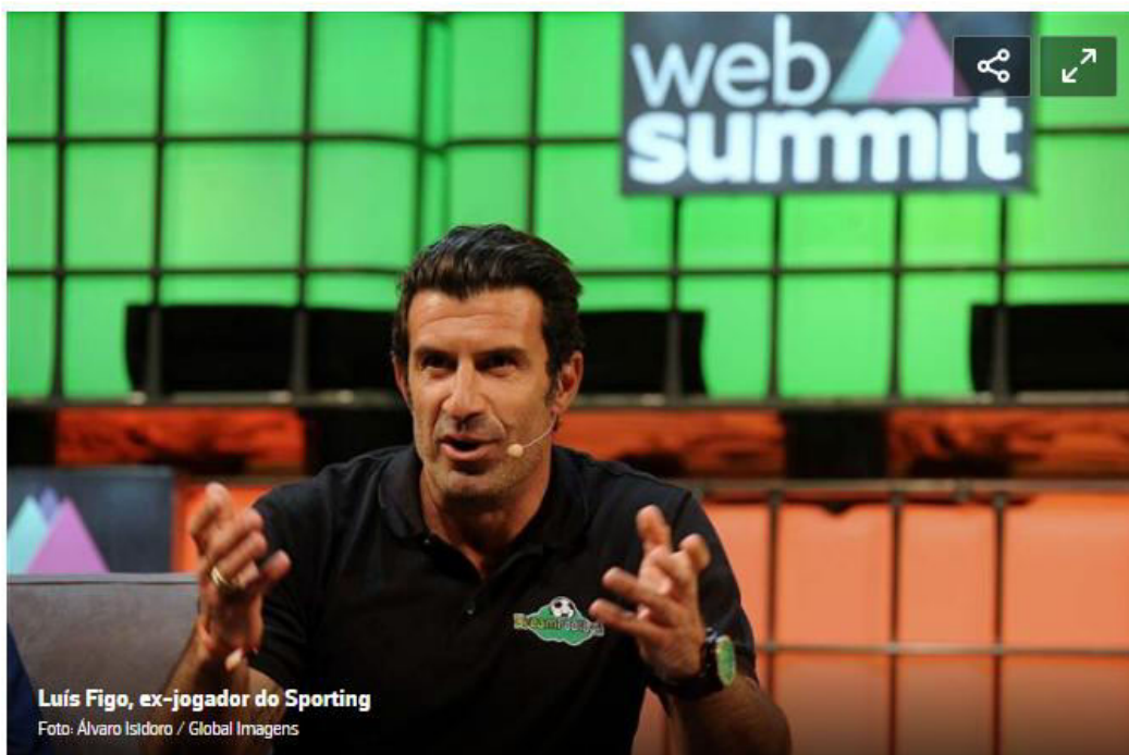
Luís Figo, ex-jogador do Sporting