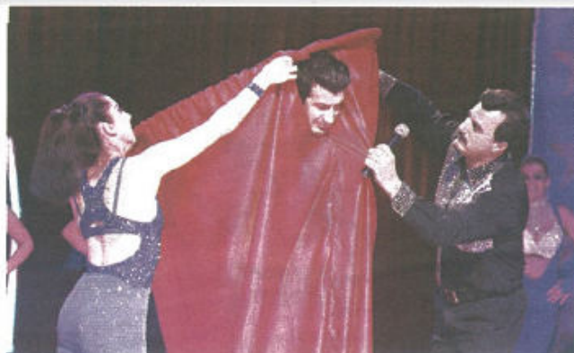
Luís Figo aceitou participar num número de magia... e ficou sem casaco

Fundação Luís Figo vai doar cerca de 3 mil brinquedos a hospitais