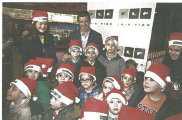
A Fundação do ex-jogador do Sporting convidou crianças carenciadas