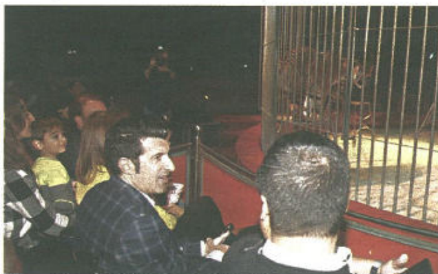
Figo assistiu ao espetáculo sentado na fila da frente e comeu pipocas